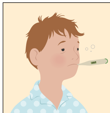
如果感覺不舒服， 請留在家裡